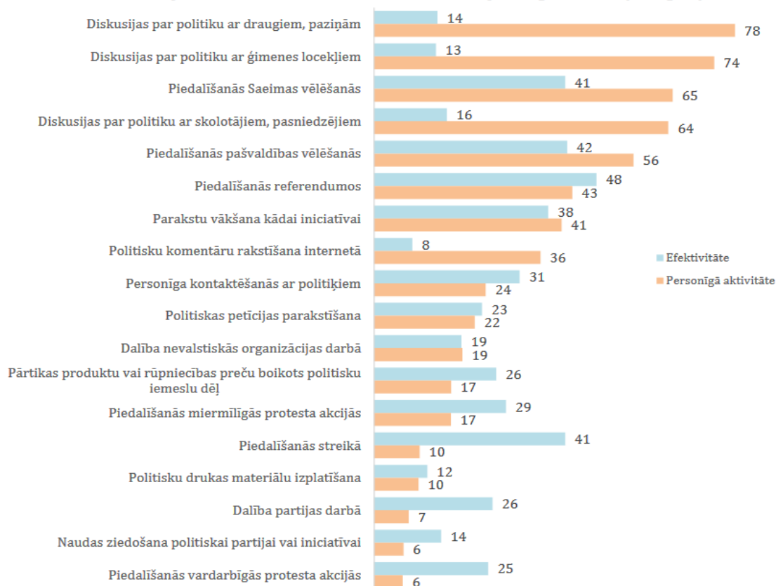
Attēls 4. Veidi politisko lēmumu ietekmēšanai: efektivitāte un personīgā aktivitāte (2015.g.; %)

Jauniešu politiskā līdzdalība Latvijā: situācijas raksturojums un līdzdalības faktoru (determinantu) analīze